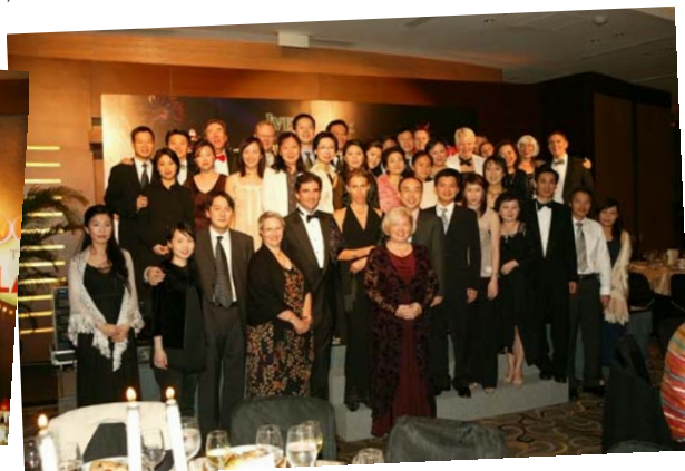
今年の香港定例夕食会は、「ビバ・ラスベガス」がテーマ。200名もの卒業生、その家族と友人が集まり、楽しく過ごしました。